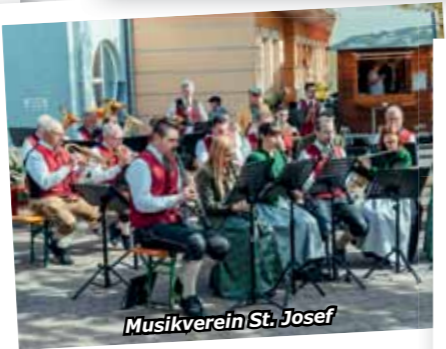
Musikverein St. Josef