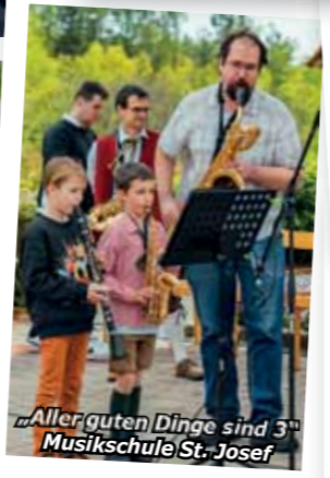
„Aller guten Dinge sind 3“ Musikschule St. Josef