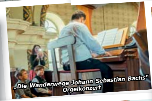
„Die Wanderwege Johann Sebastian Bachs“ Orgelkonzert