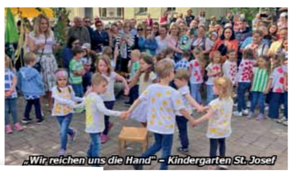
„Wir reichen uns die Hand“ – Kindergarten St. Josef