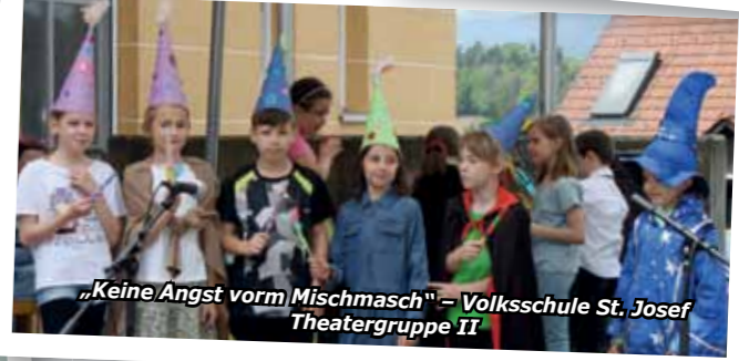
„Keine Angst vorm Mischmasch“ – Volksschule St. Josef Theatergruppe II