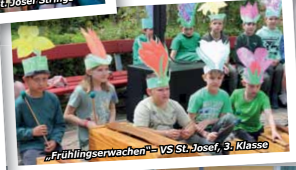
„Frühlingserwachen“ – VS St. Josef, 3. Klasse