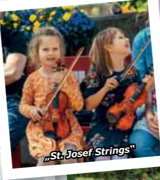
„St. Josef Strings“