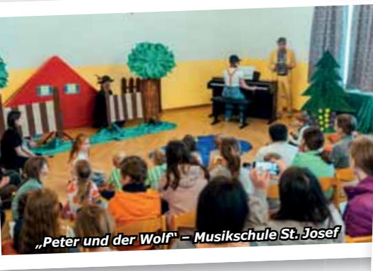
„Peter und der Wolf“ – Musikschule St. Josef