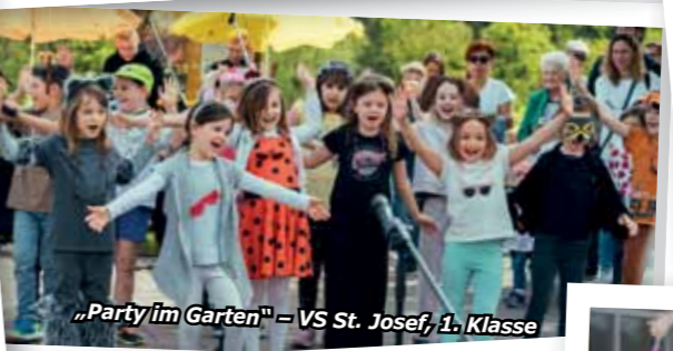
„Party im Garten“ – VS St. Josef, 1. Klasse