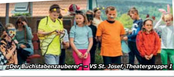
„Der Buchstabenzauberer“ – VS St. Josef, Theatergruppe I