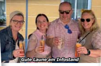
Gute Laune am Infostand