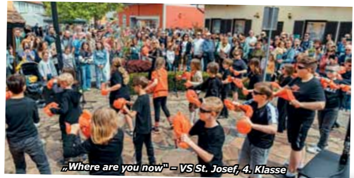
„Where are you now“ – VS St. Josef, 4. Klasse