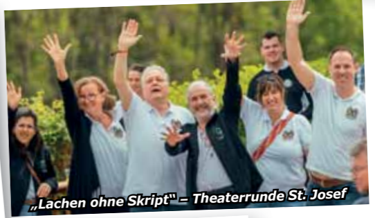
„Lachen ohne Skript“ – Theaterrunde St. Josef