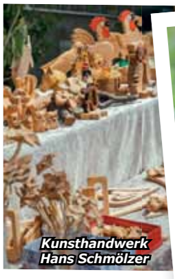
Kunsthandwerk Hans Schmölder