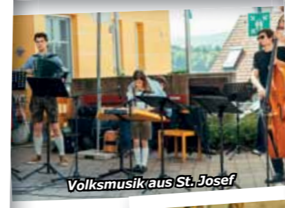
Volksmusik aus St. Josef