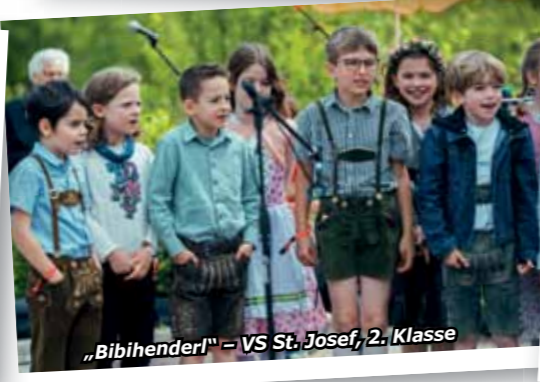
„Bibihenderl“ – VS St. Josef, 2. Klasse