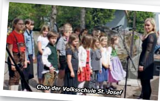
Chor der Volksschule St. Josef