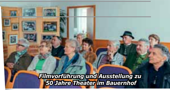
Filmvorführung und Ausstellung zu 50 Jahre Theater im Bauernhof