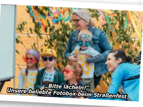
„Bitte lächeln!“ Unsere beliebte Fotobox beim Straßenfest