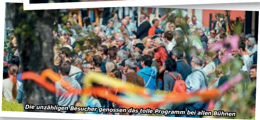
Die unzähligen Besucher genossen das tolle Programm bei allen Bühnen