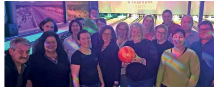
Die Teams der Gemeinde St. Josef (Weststeiermark) und vom SPAR-Markt St. Josef beim Bowlen im Hanks in Lieboch.

Ein herzliches Danke an alle Sponsoren des Bowlingabends!