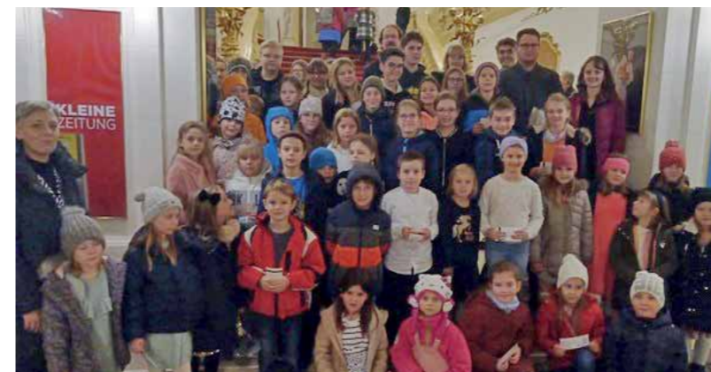
Der Musicalbesuch in der Oper war ein voller Erfolg!

Im November 2023 besuchten Kinder der Musikschule St. Josef mit einem Bus die Musicalvorstellung „Tom Sawyer“ in der Oper in Graz. Das Musical war ein voller Erfolg und die Kinder waren begeistert!