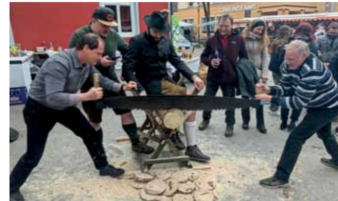
Voller Einsatz beim Josefwirt in St. Josef.

Ein weiteres Highlight wird am So, den 14. April stattfinden.