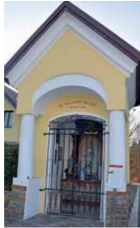
Die 2023 renovierte Leitenbauerkapelle in Fuggaberg.

Informationen zur Einreichung und Abwicklung finden Sie ebenso unter www.kultur.steiermark.at , telefonisch können Sie sich unter 0316/877 3138 (Evelyn Kometter - Referat Kunst, Kulturelles Erbe und Volkskultur) informieren.