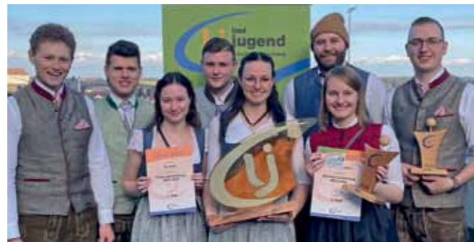
1. Platz bei der Ortsgruppenwertung.