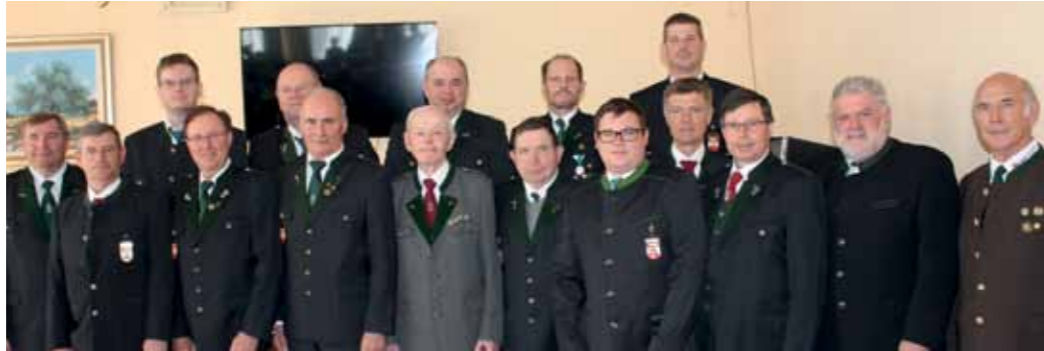
Die Anwesenden Kameraden mit den Ehrengästen und Funktionären.

Vor der Jahreshauptversammlung wurde von den Kameraden gemeinsam mit dem Musikverein St. Josef der Gottesdienst besucht