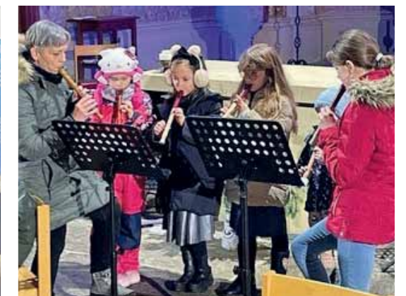
Stimmungsvolles Weihnachtskonzert in der Pfarrkirche.

Erinnerung an dieses besondere Ereignis zu haben.